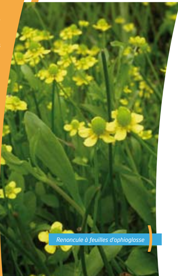
Renoncule à feuilles d'ophioglosse