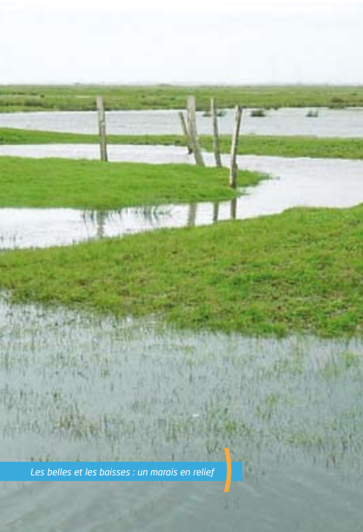
Les belles et les baïsses : un marais en relief