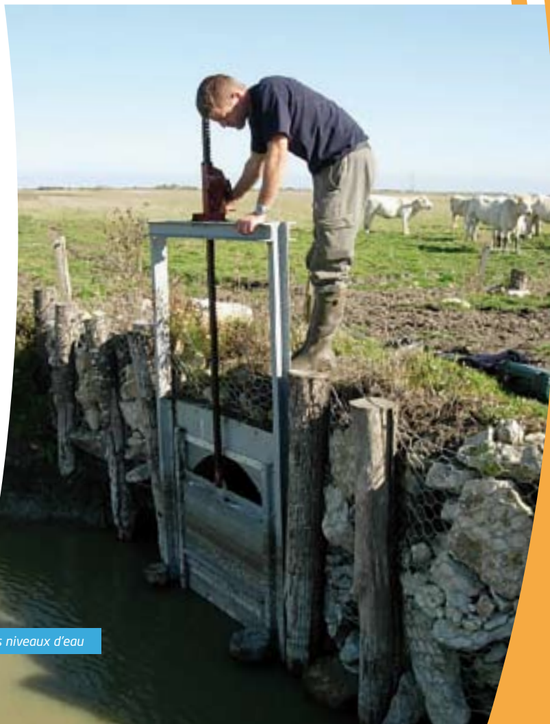
Contrôle des niveaux d'eau