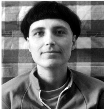
matali crasset designer

matali crasset , née en 1965, est designer industriel de formation, diplômée des Ateliers – E.N.S.C.I. Après avoir fait ses premières expériences auprès de Denis Santachiara en Italie et Philippe Starck en France, elle crée son studio à Paris, dans une ancienne imprimerie réhabilitée au cœur de Belleville. C'est là, au milieu des enfants et des voisins, qu'elle conçoit ses projets.