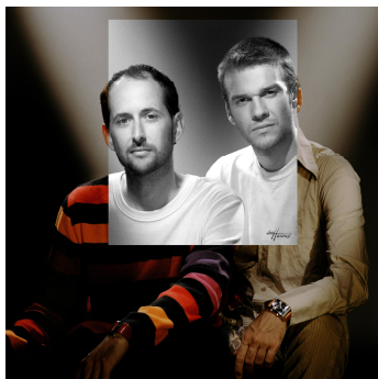
Les Sismo Designers

Les Sismo ont exposé à Milan, New York, Tokyo, Paris et même Saint-Étienne, dès la première Biennale. Ce duo farouchement indépendant a su développer et affirmer un point de vue sur le design qui les conduit aujourd'hui à aussi bien créer de la vaisselle pour Revol que monter un partenariat avec l'une des plus grosses agences françaises, Carré Noir, sur des projets internationaux.