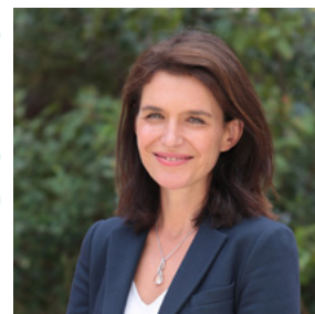
Christelle MORANÇAIS Présidente de la Région des Pays de la Loire