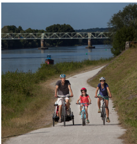
© Région Pays de la Loire / P. Chabot - Les beaux matins

En 2020, 12 projets ont été soutenus au titre du SRV, correspondant à 2,3 millions d'euros de soutien régional pour 9 millions d'euros d'investissement (soit 25% d'aide régionale).