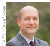
Roch Brancour , vice-président du Conseil régional des Pays de la Loire, président de la commission Transports, mobilité, infrastructures

La Région des Pays de la Loire accompagne financièrement la réalisation de liaisons douces depuis les centres-bourgs jusqu'au parvis des gares du réseau régional Aléop. À ce jour, près de 40 projets ont ainsi été subventionnés pour un investissement de plus de 3 millions d'euros . Ces projets comprennent généralement un réaménagement du parvis de la gare, une refonte des stationnements automobiles, un emplacement pour les cars, et la prise en compte du rabattement cyclable, permettant ainsi d'optimiser la gestion des différents flux de voyageurs tout en favorisant l'intermodalité et l'usage des modes de déplacements actifs dont le vélo.