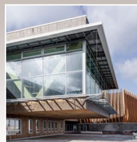
© Région Pays de la Loire / A. Monié - Les beaux matins