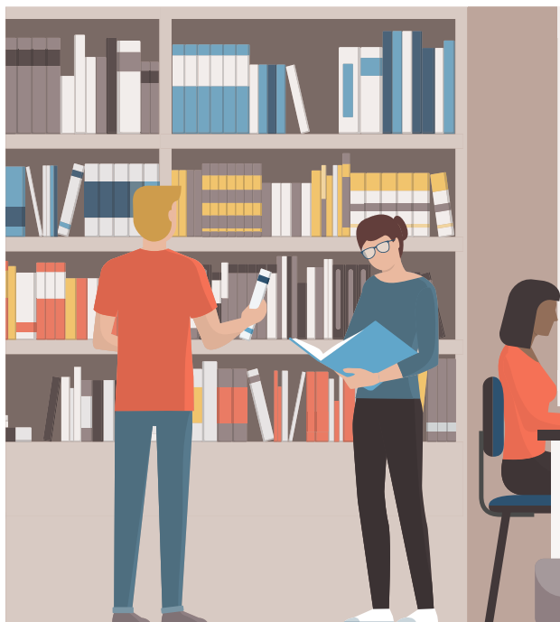
Région des Pays de la Loire - Novembre 2022