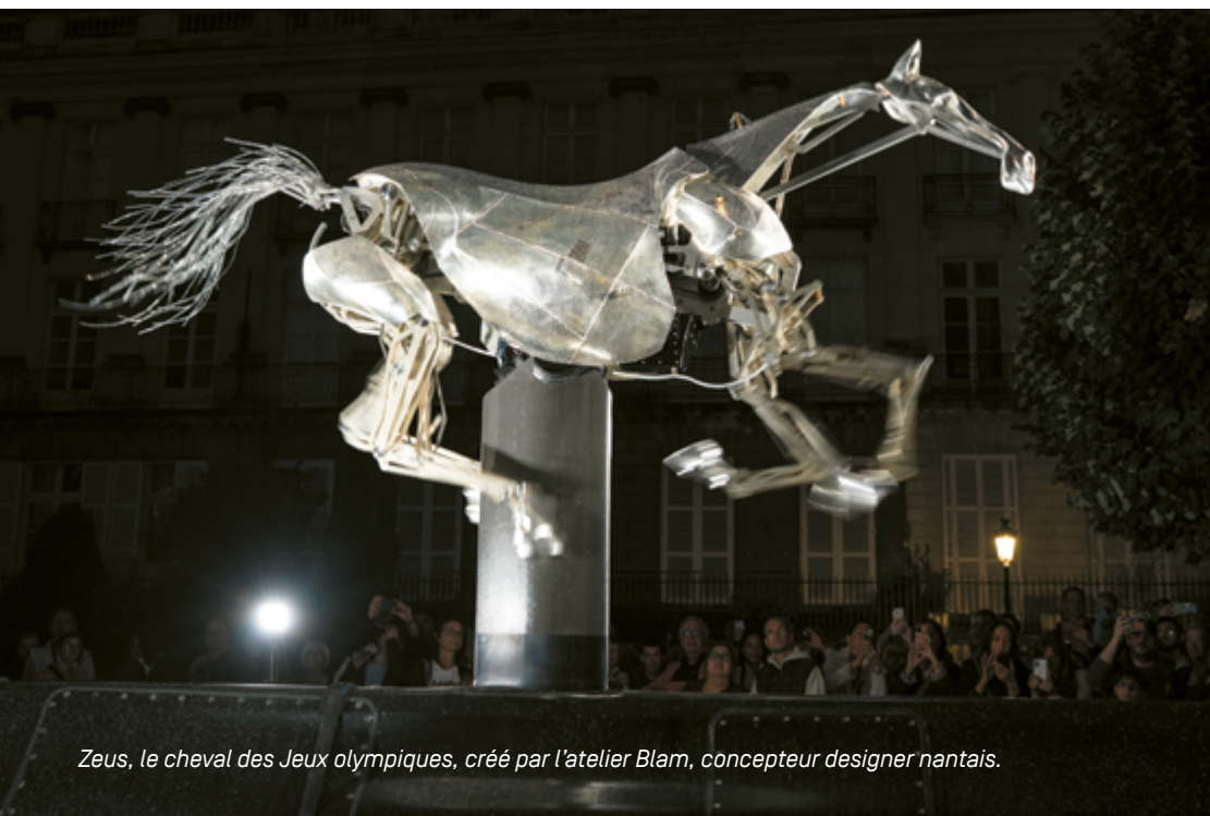
Zeus, le cheval des Jeux olympiques, créé par l'atelier Blam, concepteur designer nantais.