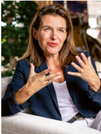
Christelle Morançais Présidente de la Région Pays de la Loire