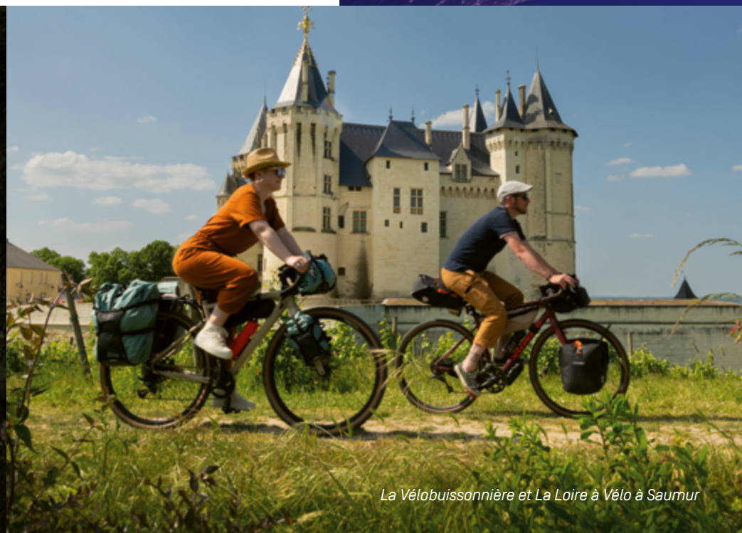
La Vélobuissonnière et La Loire à Vélo à Saumur

1 000 entreprises à capitaux étrangers ont déjà fait le choix de s'installer en Pays de la Loire.