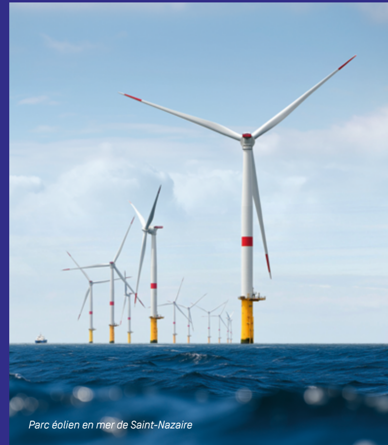
Parc éolien en mer de Saint-Nazaire

Naval Group Thalès Manitou Les Chantiers de l'Atlantique Lactalis